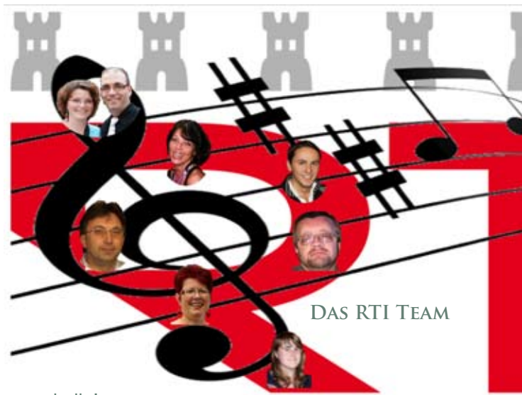
DAS RTI TEAM

Sendeplatz:jeden zweiten Mittwoch im Wechsel mit Hauptsache Musik. Lieb- lingsmusik: Balladen, deutsch, englisch. Schlager und Rock. Motto: Du kannst dem Leben nicht mehr Tage geben, aber den Tagen mehr Leben.