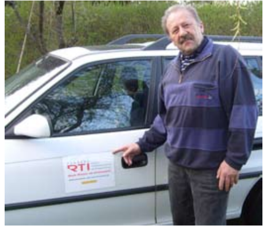
Begeisterte Hörer werben in Berlin für RTI

Wir empfehlen, diesen Service nur dann zu verwenden, wenn ihr eine Festnetz-Flatrate habt.